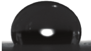
Βαμμένη επιφάνεια με SurfaPaint Aqua X Γωνία επαφής: 126°