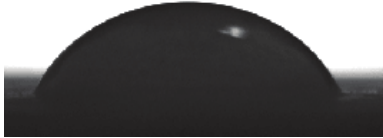
Βαμμένη επιφάνεια με απλό χρώμα Γωνία επαφής: 60°

Η σύσταση του SurfaPaint Aqua X προστατεύει και αδιαβροχοποιεί τις βαμμένες επιφάνειες επιτρέποντας τη διαπνοή τους. Είναι ιδανικό για οικοδομικές επιφάνειες που εκτίθενται σε υψηλά ποσοστά υγρασίας και αντίξοες περιβαλλοντικές συνθήκες όπως παραθαλάσσιες περιοχές. Το νερό της βροχής κυλάει στην επίστρωση παρασύροντας τους λεκέδες και τη σκόνη. Λόγω της υδαταπωθητικότητας η επιφάνεια παραμένει στεγνή με αποτέλεσμα να περιορίζεται η ανάπτυξη μούχλας. Εμφανίζει πολλή καλή πρόσφυση στο υπόστρωμα εφαρμογής και ελαστικότητα. Διατίθεται σε λευκό χρώμα και μπορεί να χρωματιστεί μόνο σε ανοικτές αποχρώσεις. Οι υδροφοβικές ιδιότητες του SurfaPaint Aqua X φαίνονται παρακάτω.